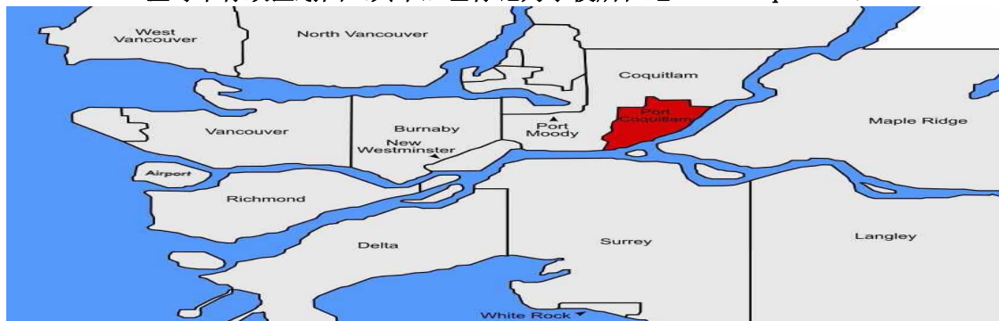
温哥华行政区划图（其中红色标记为学校所在地 Port Coquitlam）

温哥华 Vancouver 是“大温地区”11 个城市之一，高贵林港 Port Coquitlam 也是其中之一。温哥华是加拿大重要的经济、文化、旅游中心，国际化大都市，面积3000平方公里，人口260万。温哥华气候类似“春城”，PM2.5 极低，能见度 30 公里以上，全球最适合人类生活的地方之一。温哥华机场每天十几个航班直飞北京、上海、广州、青岛、沈阳、成都，中、加往来极为方便。